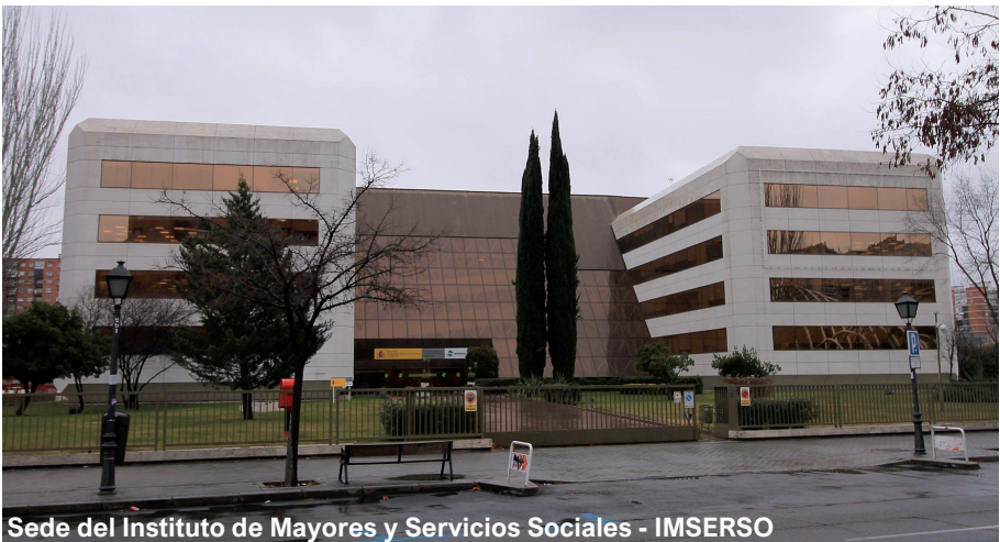
Sede del Instituto de Mayores y Servicios Sociales - IMSERSO

Autobuses: líneas 49, 67, 83, 124, 125, 127, 128, 132, 133, 134 y 137